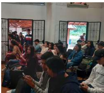
Esperando el inicio (M. Moya, 2023)